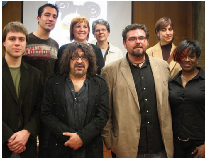
Foto de família dels membres del jurat durant la presentació.

A la final, que es va celebrar a Tordera, van arribar quatre grups. Els tres escollits pel jurat, que va voler valorar la seva qualitat musical i el darrer, Water d Vater, escollit per votació popular a través d'Internet. Destaca que durant els dies que es podia votar a través de la xarxa van ser més de tres mil les persones les que hi van accedir. Cada grup va poder penjar tres dels seus temes per escoltar. El premi del guanyador va ser una gira per diferents pobles del Maresme.