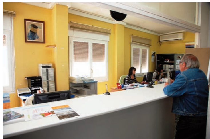
Els veïns deixaran de patir les incomoditats de l'antiga oficina.

Paral·lelament, des de la regidoria de Participació