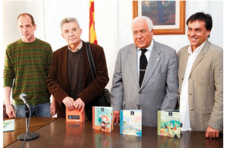
La col·lecció es va presentar a l'Ajuntament de Sant Pol de Mar

El cost dels tres primers llibres de la col·lecció, així com la futura web que es