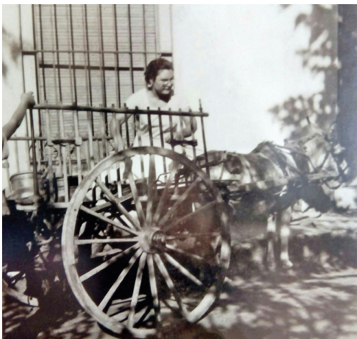
Amb el burro sí que podia baixar al poble a vendre llet

També a Can Gasofia la baixaven a casa den Carles "Bessona" (Can Castañé).