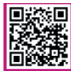
Taller per a joves