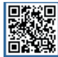
Taller de criança

Les inscripcions als tallers es poden fer a través dels formularis que trobareu escanejant aquests codis QR: